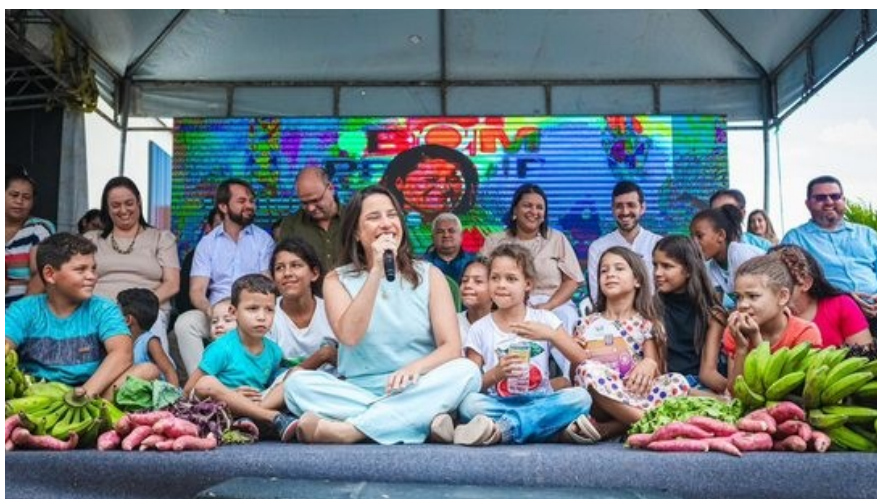
Com eleição acirrada em Caruaru, Raquel Lyra anuncia pacote de bondades para cidade